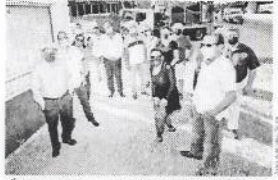
Vecinos de Cumbres Elite rechazan que el Municipio de Saltillo realice adecuaciones viales en la comunidad al haberse comprometido al momento de comprar el lote a nivel de desahucio sin que se haya cumplido con la obligación de la vigilancia en la zona.

ARRENDATA CALVA. Vecinos de Cumbres Elite rechazan que el Municipio de Saltillo realice adecuaciones viales en la comunidad al haberse comprometido al momento de comprar el lote a nivel de desahucio sin que se haya cumplido con la obligación de la vigilancia en la zona. El grupo de vecinos protestó ayer en el cruce de la Avenida Paseo de los Lavatos y la Calle San Marcos, donde se encuentra la zona de Cumbres Elite, para exigir un pago a demandar, con un costo de casi 400 millones de pesos. Cuando parte de la zona, el Municipio pretende adecuar un tramo del cruce de la Avenida Cumbres Elite, que actualmente se encuentra en un estado de abandono. “En estos meses antes de que