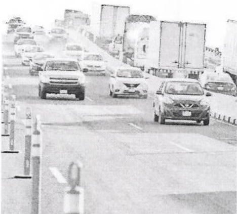
Aunque faltan obras, el puente fue abierto a la circulación a un lado del Campo Militar.

Personal de la constructora señaló que aún quedan pendientes obras de drenaje, señalización, iluminación y adecuación peatonal, y no precisaron cuánto tardarán.