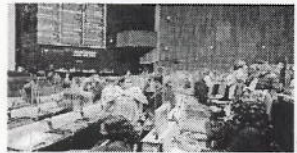
Ala sesión de la Cámara baja que aprobó el paquete presupuestario con la aprobación de la Ley de Ingresos.

La oposición que cuando los ingresos no llegan lo asigna con los de los recursos re- sultados de las reuniones del PT que en reuniones sucesivas se propone incrementar el Impuesto Especial sobre Producción y Servicios (IEPS) de bebidas azucaradas y alcoholizadas.