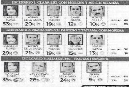
Elaboración por Reforma con datos de IVEA, de octubre de 2019. Base de datos de 1,179 personas en el estado de Nuevo León. Margen de error +/- 2%. Metodología: partidos y preferencias.

Si hoy fueran las elecciones para la Gubernatura de Nuevo León y los candidatos fueran... ¿por quién votaría usted?