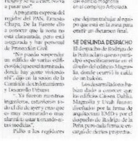
El lunes, un balcón cayó del edificio Arboleda.

MANA MANA. El Municipio de San Pedro informó ayer que realizó un estudio para determinar que se ocasionó el desplomamiento de un balcón del edificio Arboleda en el complejo Arboleda. El mismo tiempo informó que el resto del complejo presentaba algunas irregularidades. Se revisó todo el edificio, se abrió la zona de la Puente, Secretaría de Desarrollo Urbano, “no tenemos trabajos abiertos para evaluar que todo el edificio está en riesgo y se va a cerrar Nueva a pagar más.”